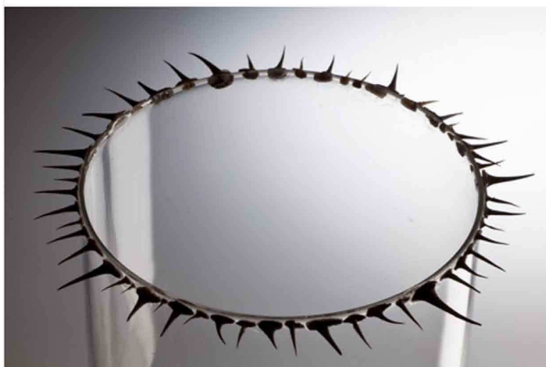
← Elisabetta Di Maggio, Senza titolo , vetro soffiato e spine di rose, 2013