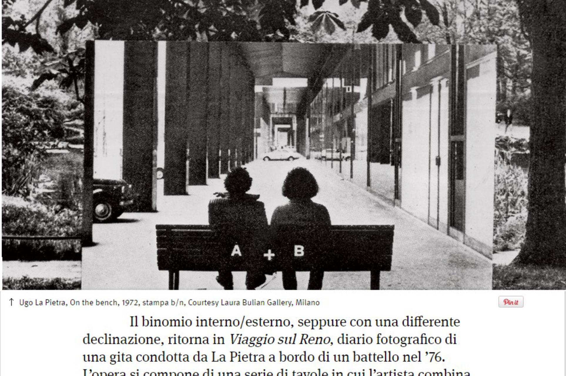
↑ Ugo La Pietra, On the bench, 1972, stampa b/n

La mostra apre con una serie di tavole, il cui titolo, Abitare è essere ovunque a casa propria , suggerisce un tentativo di risignificare il verbo 'abitare'. Tentativo che diviene esplicito nel manifesto che accompagna l'esposizione, in cui La Pietra avanza un'idea di abitare come pratica attiva di autogestione dell'ambiente urbano. Nelle tavole appartenenti a questa serie, La Pietra sembra attenersi, anche se non sempre fedelmente, a un preciso schema compositivo. Mentre nella parte superiore ritrae fotograficamente porzioni di città, in quella inferiore, abbandona ogni realismo e si concede alla fantasia. Sia nella tavola del 1980 che in quella del '75, l'artista ritrae sommarie l'immagine fotografica soprastante, e vi inserisce, al centro, il disegno di un interno domestico. La rappresentazione non ha pretesa di fattibilità, ma serve da monito e sollecitazione. Monito verso la spersonalizzazione incalzante dei luoghi pubblici, e sollecitazione a riaddomesticarli. Dietro le quinte da teatro, un salotto si apre verso la strada. Le linee morbide e i toni colorati delle poltrone invitano i passanti a mettersi comodi.