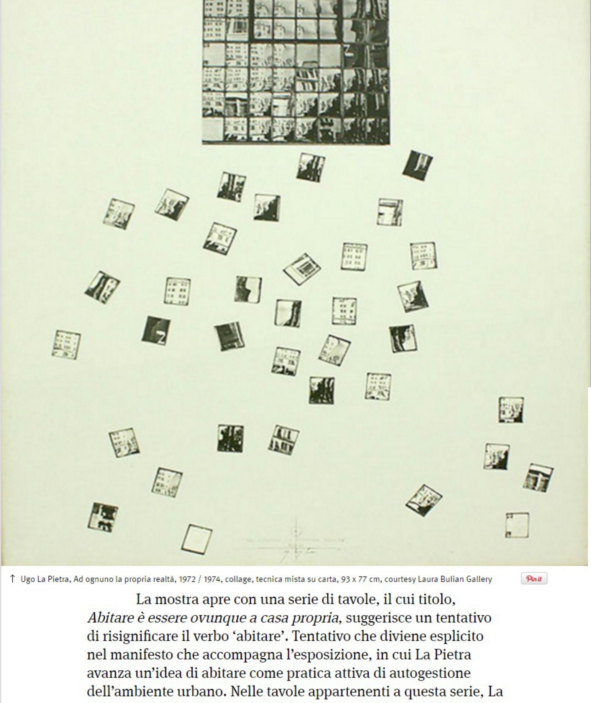
↑ Ugo La Pietra, Ad ognuno la propria realtà, 1972 / 1974, collage, tecnica mista su carta, 93 x 77 cm, courtesy Laura Bulian Gallery

La selezione di opere di Ugo la Pietra esposte alla galleria Laura Bulian per la mostra Gradi di Libertà , sembra accogliere, o meglio anticipare, l'appello lefebvrino a liberarsi dell'illusione di trasparenza delle rappresentazioni geometriche dello spazio, e a disegnare nuove cartografie che includano modalità non convenzionali di vivere e plasmare la città.