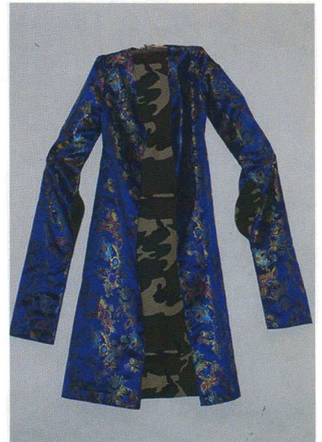
Reza Aramesh "Action 110" (2010) Triptych, silver gelatin print on aluminium, 195 x 270 cm