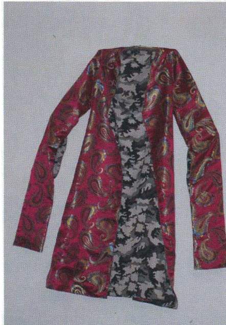
Said Atabekov "United States Marines in Central Asia" # 2, (2008) Cotton and silk